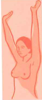
Şekil 2: Kendi kendine meme muayenesinde memelerin eller havadayken gözlemlenmesi

Bu incelemenin toplam beş ayrı pozisyonda yapılmasının amacı meme dokusunun arkasında kalan kasların çeşitli pozisyonlarda farklı şekilde kasılmasının ve böylece meme dokusundaki muhtemel habis oluşumların gözle görülebilir hale gelmesinin sağlanmasıdır. Memedeki habis kitleler çoğu durumda memeye sabit bir duruş kazandıran Cooper bağlarının ve meme arkasındaki kasların işlevlerini bozar ve bu durum memeye çeşitli pozisyonlar verilerek belirgin hale getirilebilir.