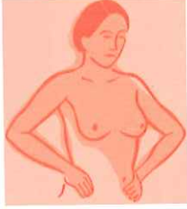
Şekil 1: Kendi kendine meme muayenesinde memelerin eller kalçalardayken gözlemlenmesi

Elleriniz kalçalarınızdayken (yukarıdaki resim), avuçlarınızı önde sıkarken, kollarınız yanlarda serbest sallanır durumdayken, elleriniz havadayken (aşağıdaki resim) ve vücut öne serbestçe eğilmiş durumdayken, toplam beş ayrı pozisyonda her iki memenizi aynada iyice inceleyin.