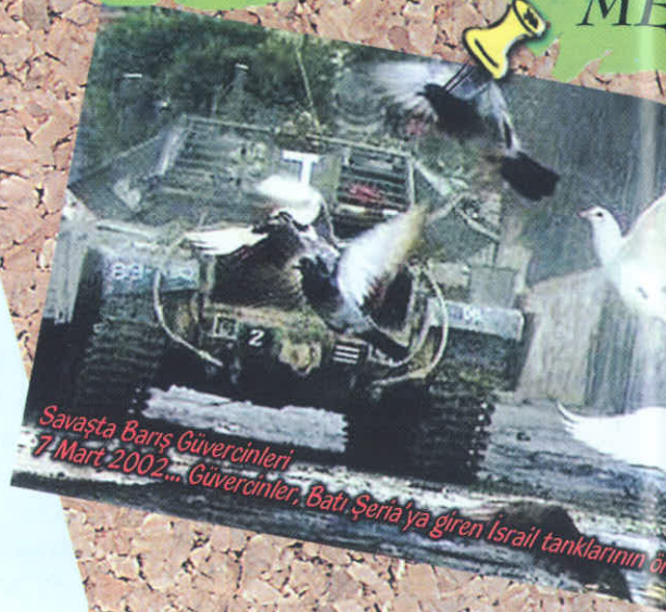
Savaşta Barış Güvercinleri 7 Mart 2002... Güvercinler, Batı Şeria'ya giren İsrail tanklarının önüne geçtiler.

Kriz kelimesi çince yazıldığında iki harften oluşmakta, bu harflerin biri tehlikeyi, diğeri ise fırsatı temsil etmektedir.