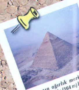
dünyanın en büyük mekânı Yüksekliğinin (146 m) bir arasındaki uzaklığı ver Taban alanının, yüks verdiği

Narcissusu' u bilirsiniz; öyle heybetli ve güzelmiş ki, bakmaya dayanamazmış kendine ... Gün boyu ayna karşısına geçip, kara gözlerini, incecik burnunu, dar kalçalarını, kıvrık saçlarını seyredermiş hayran hayran... Bir gün ırmağın kenarında gezinirken, suda yansımaya ilişmiş gözü... Uzanıp iyice bakmak istemiş. Tam gördüğünde kendini, dengesini kaybedip düşürmüş ırmağa, kapılıp gitmiş suya... Yeryüzünün en güzel insanının öldüğünü duyan Tanrı, unutulmaması için O'nu her bahar açan güzel kokulu bir çiçeğe dönüştürmüş. Narcissus, nergis olmuş. Kissadan hisse, benden size tavsiye, taze bir nergiz verin bugün sevgilinize... Sonrada nerede baharsa mevsim, rotasını oraya çevirip içinizde ki eski baharlara koşan bir gezgin gibi "bahar getirdim sana" deyip baharın elinizde olduğunu unutmadan ... Gözlerindeki ırmağa baktığınızda kendinizi göreceksiniz; dikkat edin de hayran olup düşmeyin! Düşüp bir bahar kokulu bir çiçeğe dönüşmeyin... Can DÜNDAR