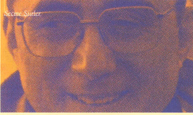
Ataol Behramoğlu (d. 1942, Çatalca)

İlköğretimini Kars ve Çankırı'da, ortaöğrenimini Çankırı Lisesi'nde yükseköğretimini Ankara Üniversitesi Dil ve Tarih Coğrafya Fakültesi Rus Dili ve Edebiyatı Bölümü'nde tamamladı. İlk kitabı 1965'de yayımlanmıştı. İkinci kitabı Bir Gün Mutlaka (1970) ise geniş yankılar uyandırdı. 1970-74, 1984-89 yılları arasında on yıla yakın bir süre yurt dışında kaldı. Moskova ve Paris Üniversitelerinde edebiyat, dil çalışmaları yaptı. Ataol Behramoğlu'nun lotus (Asya-Afrika Yazarlar Birliği) 1981 Edebiyat Büyük Ödülü verilen bütün şiirleri üç cilt halinde Adam Yayınları'nca yayımlandı: Bir Gün Mutlaka (1991), Yaşadıklarımın Öğrendiğim Birşey Var (1991), Kızıma Mektuplar (1992).