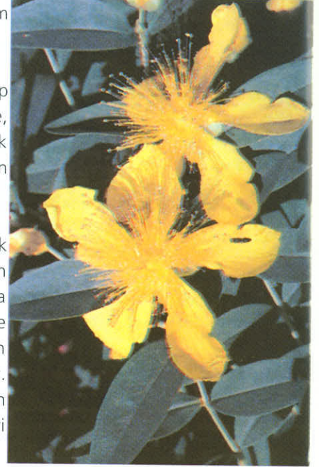
"Doğanın Prozac"ı Sarı Kantaron

Bitkilerin bileşiminde bulunan maddelerin miktarları yetiştikleri iklim, toprak çevre gibi koşulların yanısıra toplandıkları mevsim, gelişim evresi, toplandıktan sonraki işleme şekilleri, saklama koşulları, saklama süreci gibi çok sayıda faktörün etkisi ile önemli değişkenlik göstermektedir. Dolayısıyla, bu faktörlere dikkat edilmeden toplanan ve işlenen bitkisel materyal ile uygulanan fitoterapinin çağdaş bir tedavinin beklentilerini karşılaması mümkün değildir. "Bundan dolayıdır ki; dileğimiz tıbbi bitkiler üzerine bilimsel çalışmaların ülkemizde yaygınlaşması ve eczacılarımızın bu konudaki "danışmanlık" görevleri üzerinde hassasiyetle durmasıdır.