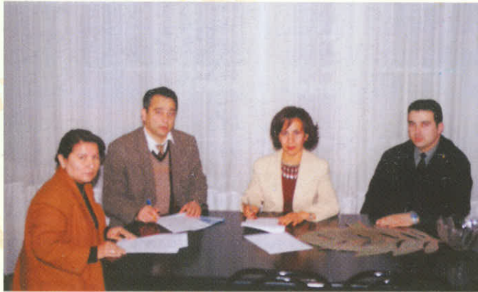
Sosyal Hizmetler İl Müdürlüğü Protokolü imza töreni...

• 2003 Mali Yılı Bütçe Uygulama Protokolü Ve Bağ-Kur Protokolü İle İlgili Önerilerimiz Mevzuat Komisyonunca Oluşturulup, Gönderilmiştir.