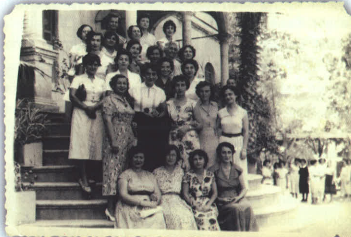
1956 ders yılı Adana Kız Lisesi Öğretmenleri

Oysa 30'lu, 40'lı, 50'li yıllarda ülkemizde henüz her ilde dahi lise eğitiminin verilemediği ortamda Türkiye'nin dört bir tarafından paralı veya parasız pekçok öğrencinin geldiği bu seçkin okul; şu an çok iyi mevkilerde bulunan pekçok öğrenci mezun etmesiyle tanınıyor. Parlamentoda uzun dönem bakanlık yapmış olan sayın İmren Aykut da Adana Kız Lisesi'nin ünlü mezunlarından biri.