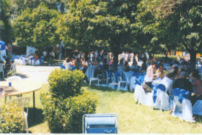
• 31 Mayıs Cumartesi;