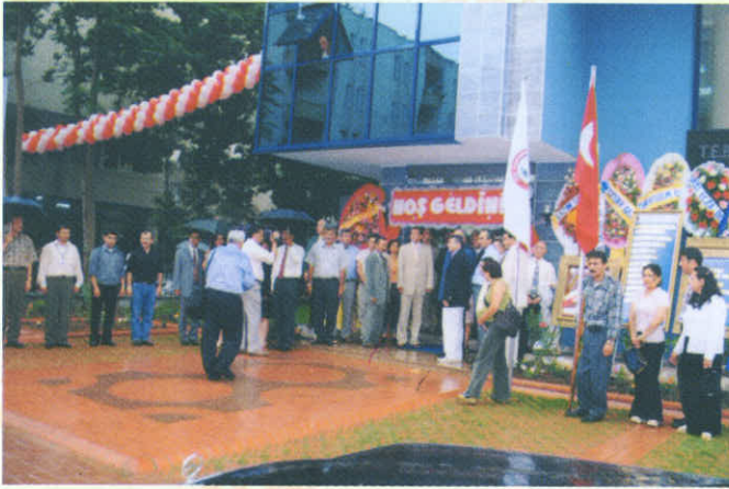
• Adana Eczacı Odası Yeni Hizmet Binasının açılışı yoğun katılımıla gerçekleşti.