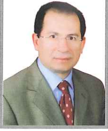
Ecz. Şevket Kaya