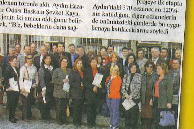
Türkiye'de ilk kez Aydın'da başlatılan "Bebek Dostu Eczane" projesine katılan 120 eczacıya sertifikaları törenle verildi.

ilk olmaları için mamalarla değil, anne sütü ile beslenmelerini istiyoruz. Ancak annelerin mama kullanımını tercihlerine de engel olamayız. Fakat bebek mamalarının marketlerde sağlıklı koşullarda satışına da engel olacağız. Anne sütünü teşvik etmek için de eczanelerimizdeki mama reklamlarını kaldıracağız" dedi. Kaya, projeye ilk etapta katıldığını, diğer eczacıların da önümüzdeki günlerde bu uygulamaya katılacaklarını söyledi.