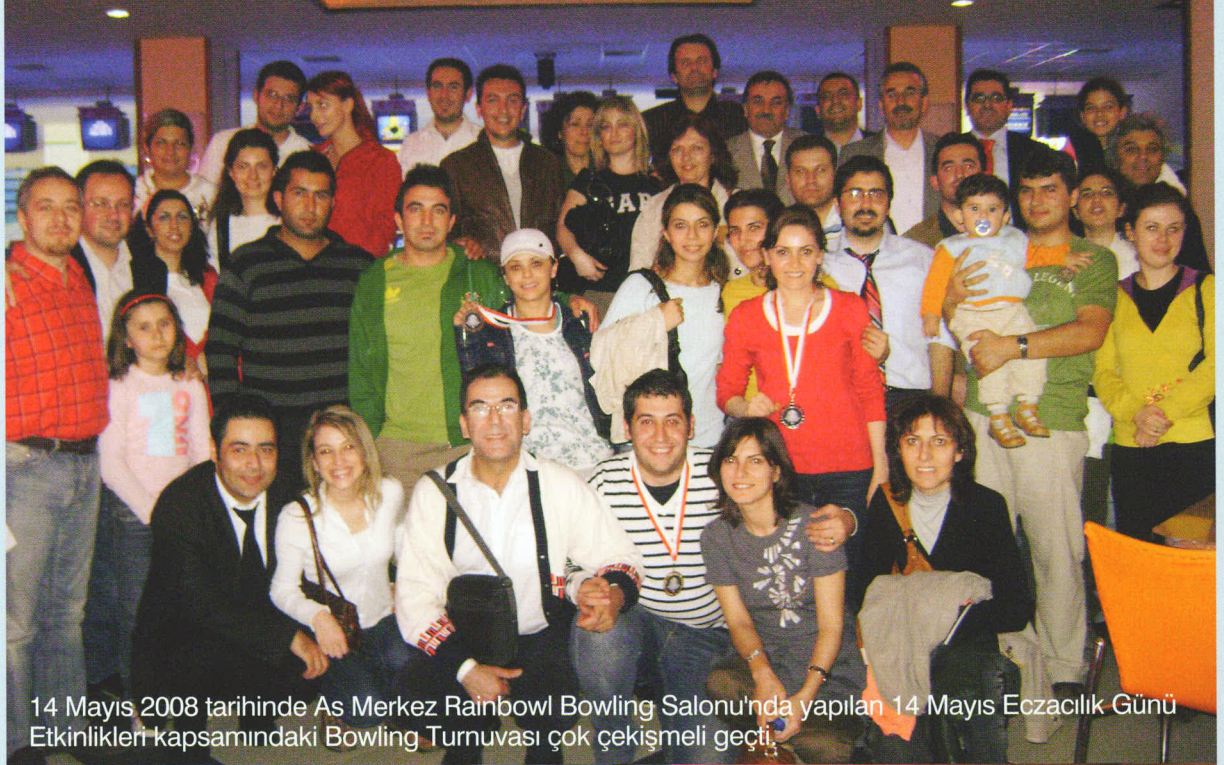
14 Mayıs 2008 tarihinde As Merkez Rainbowl Bowling Salonu'nda yapılan 14 Mayıs Eczacılık Günü Etkinlikleri kapsamındaki Bowling Turnuvası çok çekişmeli geçti.