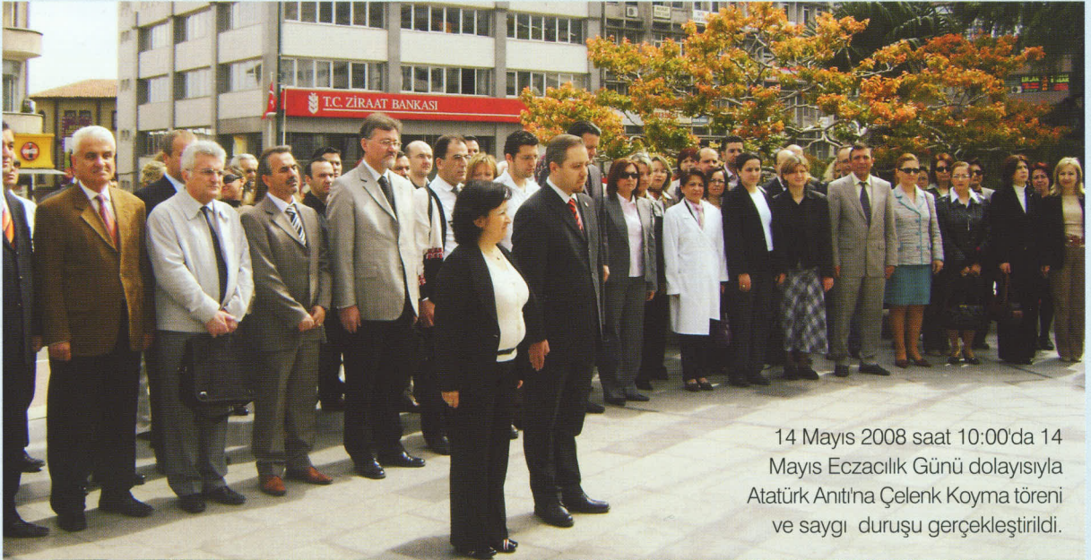
14 Mayıs 2008 saat 10:00'da 14 Mayıs Eczacılık Günü dolayısıyla Atatürk Anıtı'na Çelenk Koyma töreni ve saygı duruşu gerçekleştirildi.