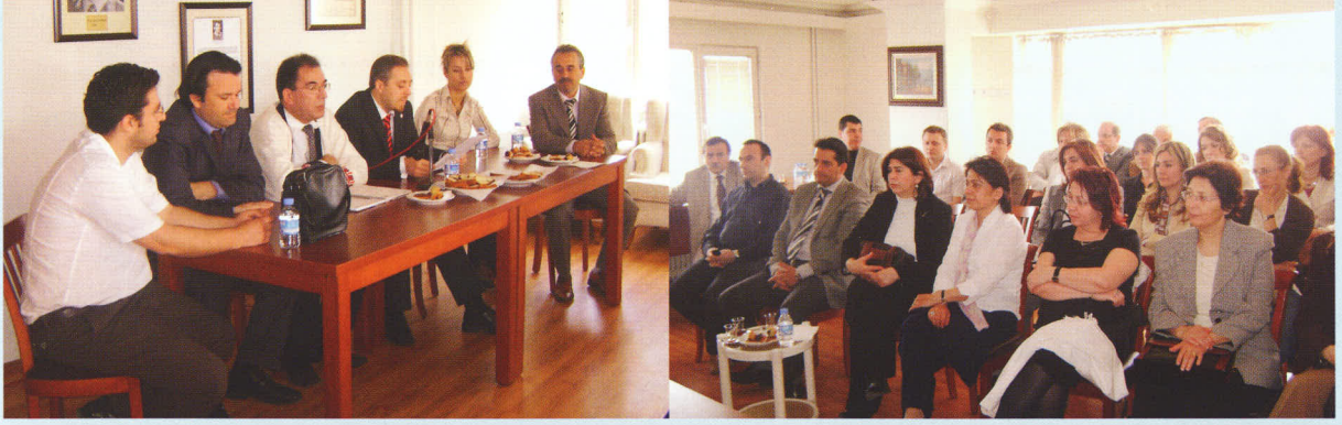
14 Mayıs 2008 tarihinde saat 11:00'de Bursa Eczacı Odası Ecz. Naci Doğan Eğitim ve Kültür Merkezi'nde 14 Mayıs Eczacılık Günü basın açıklaması yapıldı.