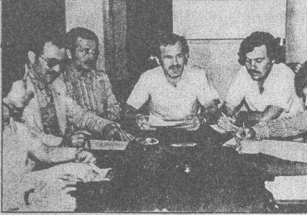
Basın toplantısı düzenlediler...

Eczacılar, tam gün çalışma tazminatının yüzde 50' den yüzde 100' e çıkarılmasını istiyor