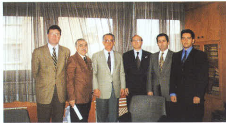
Emekli Sandığı İl Müdürü