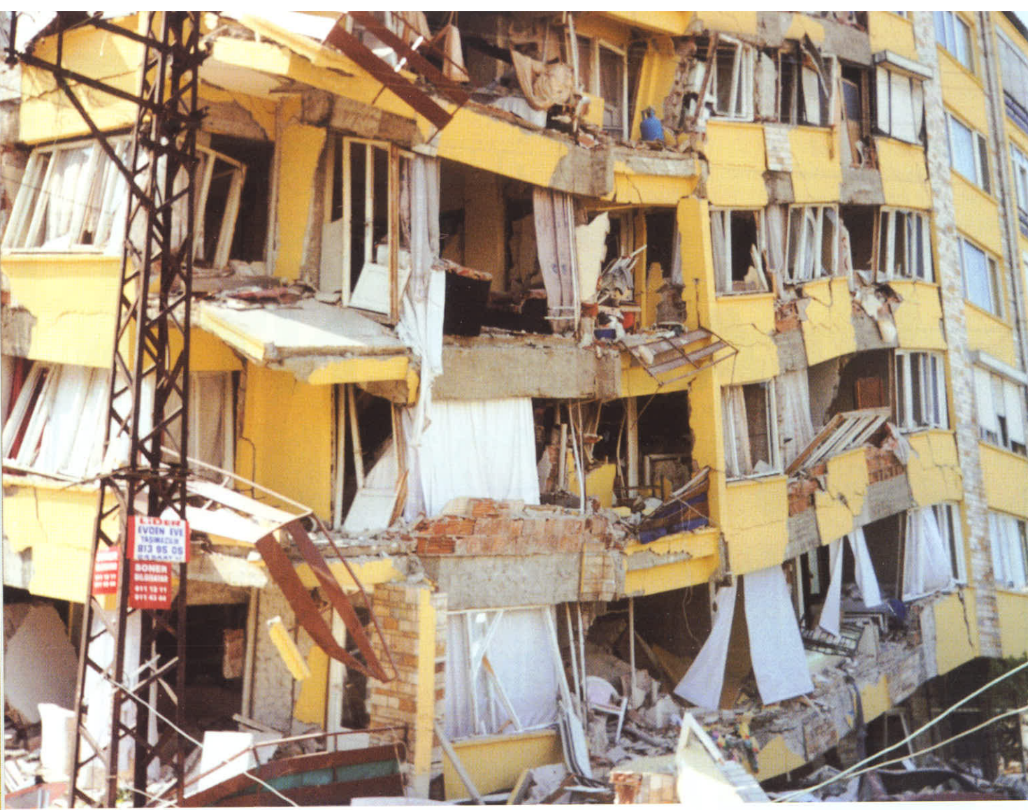
17 Ağustos 1999 / Yalova

17 Ağustos'ta yaşadığımız, büyük depremin ardından neredeyse bir mevsim geride kaldı. Enkazlar kaldırıldı, yaralılar iyileşti, iş yerleri tekrar açıldı, insanlar yine yaşam mücadelelerine devam etmeye başladı. Ama acı gerçekleri hala yüreklerinde hisseden insanlar, imkansızlıklar içinde ne yapıpta bu psikolojiden kurtulacaklardı? Kış geldi havalar soğu da çadırda yaşam daha ne kadar insanlara yeterli olabilirdi. 30 Kasım tarihini umutla bekleyen insanlar sıcak bir çatı altına girmenin umutlarını yaşadılar günlerce, işte o tarih geldiğinde yine somut olan çok az şey gerçekleşti. Belli ki insanlar yine önceki umutlarıyla yaşamaya devam edeceklerdi. Bunların içinde Yalova yine şanslı olan bir ilimiz, alınan bilgilere göre 30 Kasım itibarı ile %75 geçici konut ihtiyacı giderilmişti. Diliyoruz ki diğer illerdeki vatandaşlarımızın da bu soğuk kış günlerini sıcak bir yuvada geçirsinler.