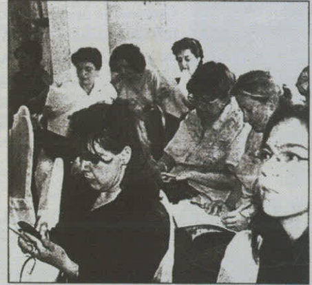
Eczacılar, Bağ-Kur İl Müdürlüğü'ne gönderilmek üzere hazırladıkları ihtarnameyi notere teslim ettiler.