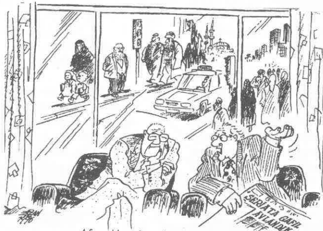
- Afganlılar da çok uyumuş birader...

Geçen ay karakoldan bir pusula geldi, "acilen savcılığa ifade vereceksin" diyor. Araştırdık, Y.O.K oda başkanımız, genel sekreterimiz ve bendeniz hakkında suç duyurusunda bulunmuş. İnsan meslek örgütlerinde bunca yıl kelle koltukta çalışınca, bu tür olaylara bağışıklık kazanıyor. Yirmi yıl önce de surşarjın yasak olduğu dönemde ihbar edilip, eczanemin mühürlendiği günden bu yana, bayağı bir karakol ve adliye havası solumuşluğum var. Gittik verdik ifademizi, şimdi mahkemeye verilmeyi bekliyoruz. Ancak birkaç keyifli anı sahibi daha oldum ki, vallahi ömre bedel, ama neşriyatı gelecek program!