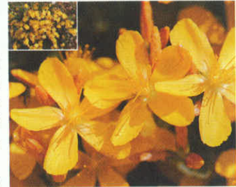
Binbirdelikotu Uludağ'da bolca bulunur.