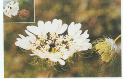
Yabani havuç ülkemizin doğusunda bolca bulunur