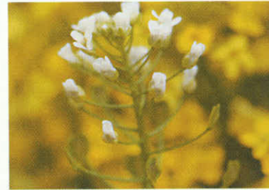
Çoban çantası Capsella bursa - pastoris