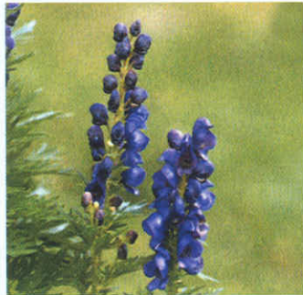
Aconitum, çok zehirli bir bitki