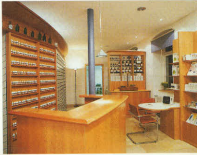
Homöopatik ilaçlar satan eczaneden bir görüntü

Allopatik düşüncede hastalığın nedeni bakteriler, virüsler, mantarlar ve diğer bulaşıcı mikroplardır ve bunlarla radikal