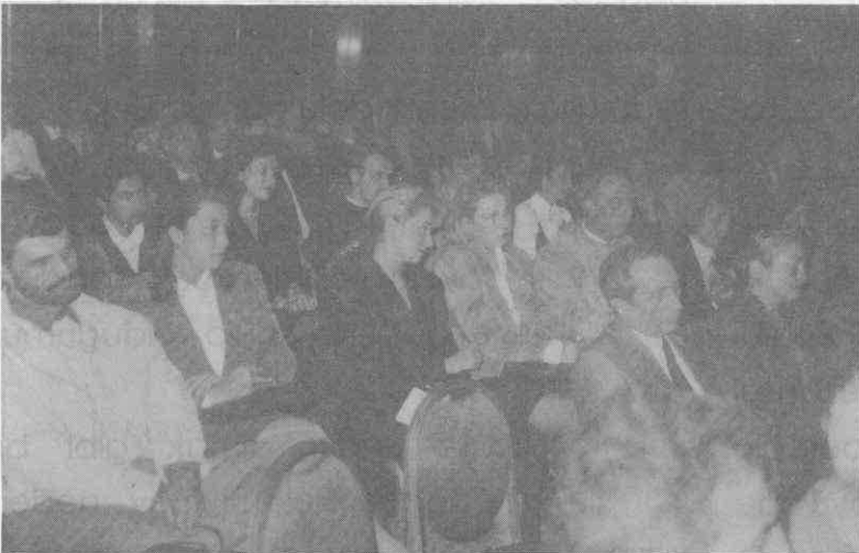
Toplantıda sunulan bildiriler meslekdaşlarımız ve konuklar tarafından ilgiyle izlendi.