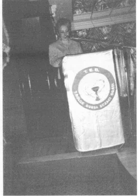
Yönetim Kurulu Başkanı, toplantı açış konuşmasını yaparken