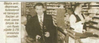
Başta anti-depresan, kolesterol ve tansiyon ilaçları olmak üzere birçok ilacın fiyatı yüzde 1-75 arasında ucuzladı.

Bursa Eczacılar Odası olarak sorunlarını olduğu kadar yerel, ulusal ve dünya gündemi ile ilgili düşüncelerini çeşitli yollarla kamuoyuna duyurmaya çalıştıklarını belirttikleri ana sorun