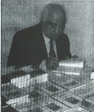
Ünlü Diyarbakırlı yazar Mıgırdiç Margosyan, söyleşiden sonra kitaplarını imzaladı.

14 Mayıs Eczacılık Bayramı etkinlikleri kapsamında Diyarbakır'a gelen yazar Mıgırdiç Margosyan, Diyarbakır Büyükşehir Belediyesi tiyatro salonunda söyleşi yaptı. Diyarbakır'da geçmişteki anılarını acı ve esprili bir üslupla anlatan Margosyan, daha sonra kitaplarını imzaladı.