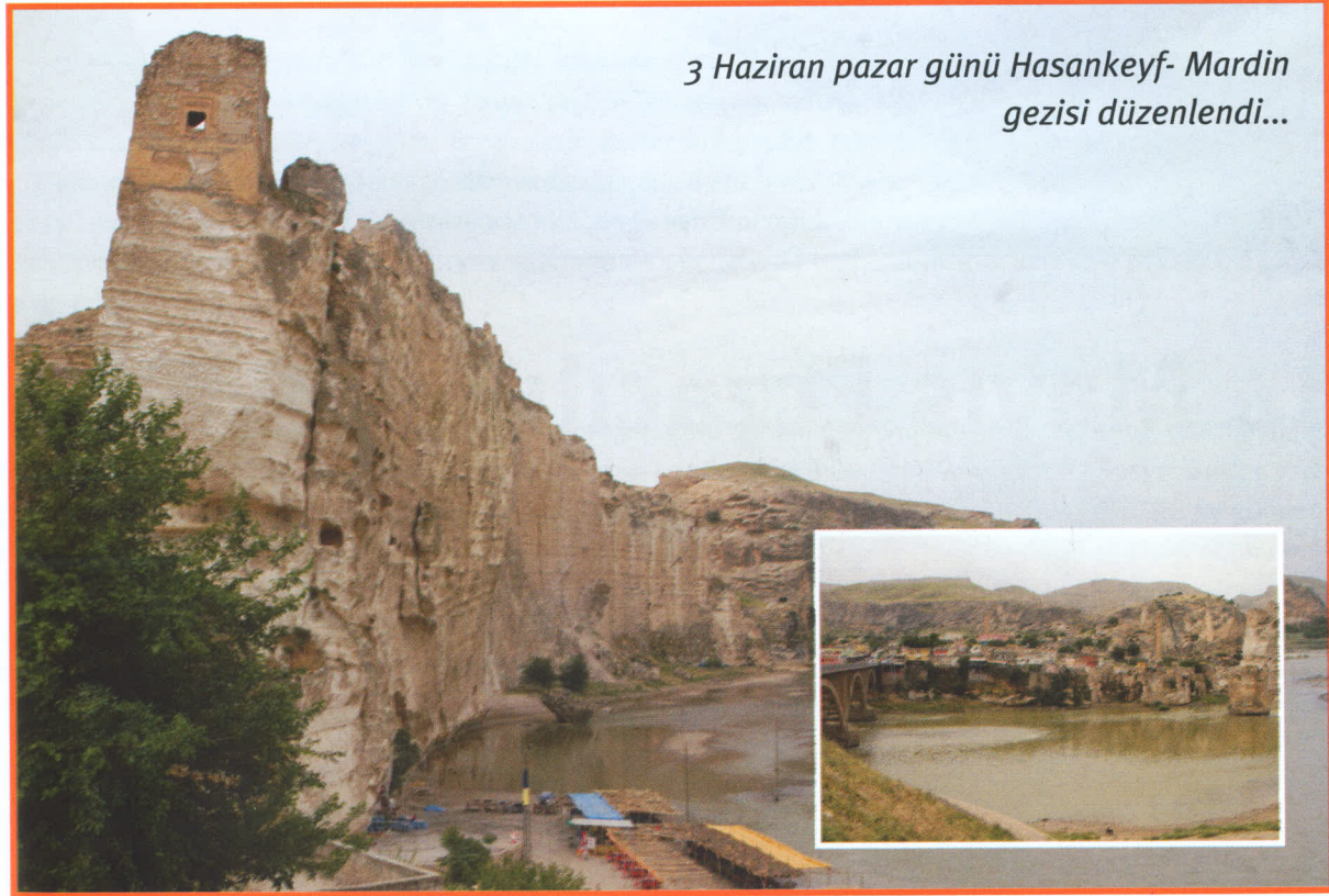
3 Haziran pazar günü Hasankeyf- Mardin gezisi düzenlendi...