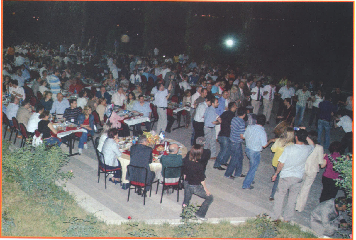
01 Haziran 2007 - Gazi Köşkü