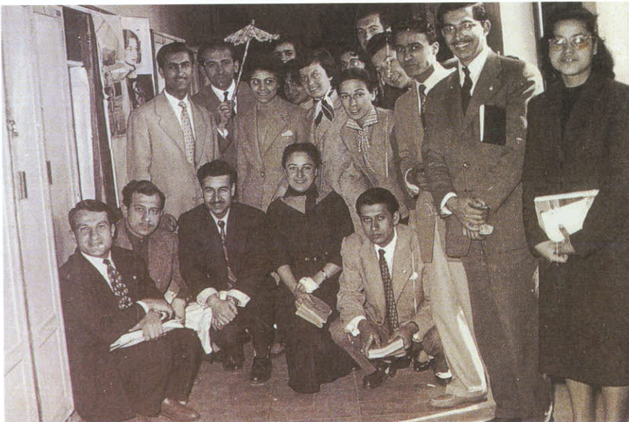
İstanbul Eczacı Okulu, laboratuvar koridorunda sınıf arkadaşları ile, 1955.