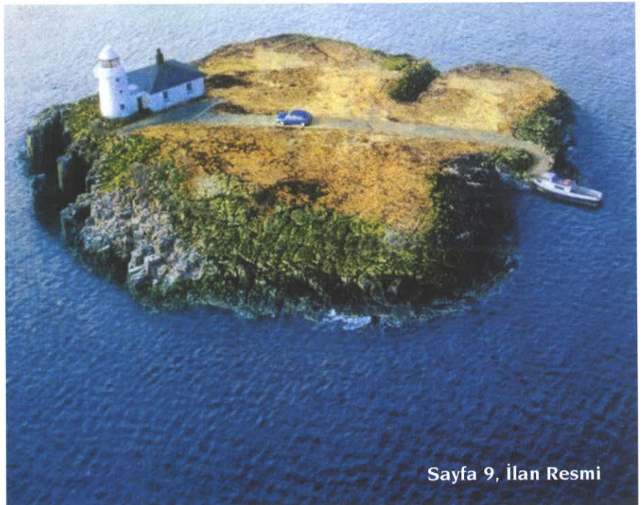
Sayfa 9, İlan Resmi