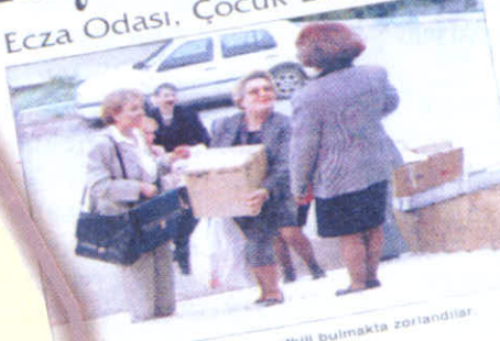
Eczacılar, kuruma yetkili bulmakta zorlandılar.