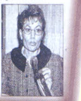
Eczacılar, kuruma yetkili bulmakta zorlandılar.