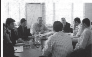
İstanbul Ecza Koop temsilcileri Tekirdağ Eczacı Odası'nda.

İstanbul Ecza Kop'un hizmet bölgelerinden Trakya'da bulunan Edirne, Kırklareli ve Tekirdağ Eczacı Odaları ziyaret edildi.