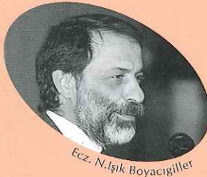
Ecz. N.İşık Boyacıgiller