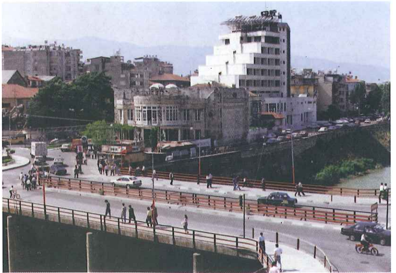
Antakya - Köprü ve Sineması ( BUGÜNÜ)

Bu anlaşmadan sonra Genel Kurmay II. Başkanı Org. Asım GÜNDÜZ 13 Haziran 1938'de Antakya'ya geldi. Bugünlerde Yenigün Gazetesi şehirdeki yer ve kurum isimleri ile bazı