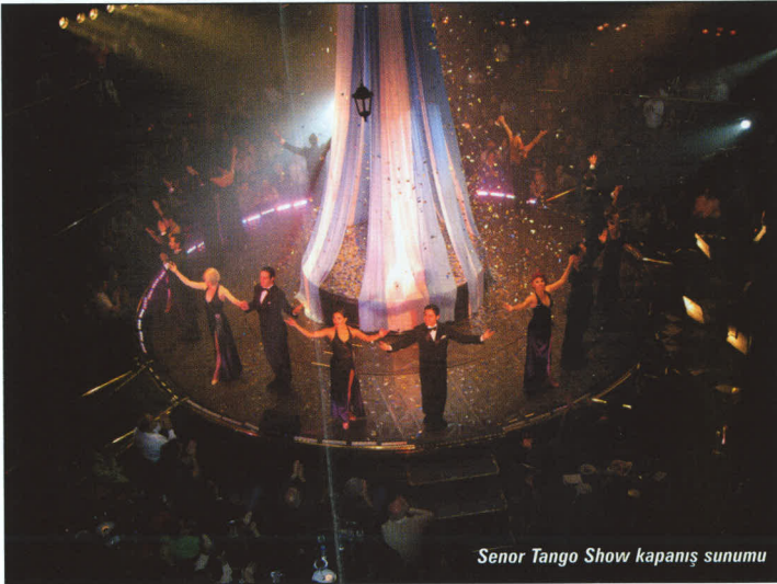
Senor Tango Show kapanış sunumu

buçuk saatlik uçuşla İguazu Şelalelerine geliyoruz. Uzun bir süredir bölgede yağmayan yağmurla karşılaşıyoruz. Yağmura inat, yağmurluk alarak akşama kadar şelaleleri bir bir geziyoruz. Arjantin, Brezilya ve Paraguay sınırları arasında yer alan İguazu Şelaleleri İguazu Milli Parkı içinde. İguazu Milli Parkı, 275 adet şelaleyi ve 2000'den fazla bitki türünü barındıran, yaklaşık