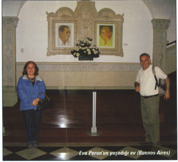
Eva Peron'un yaşadığı ev (Buenos Aires)

21.000 km 2 'lik 5000 su kanalından oluşan deltada yapacağınız tekne turunda, ula-