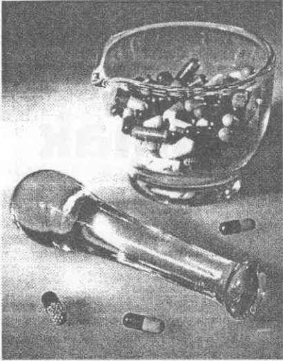
Eczacı Profil Araştırmasından Çıkan Bazı Sonuçların Kadın Eczacılar Bağlamında Değerlendirilmesi: Şekilde görüldüğü gibi, eczacılık mesleğini yapan kadınların oranı erkeklerden daha fazladır.