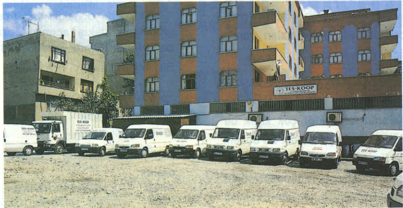
17 Ağustos öncesi son 4 aylık dönemde TES-KOOP her alanda büyüyordu

TES - KOOP'un hiç bir bankaya, ortağına ve çalışanına borcunun bulunmadığı, enkaz altında kalan ilacın satılarak firmalara olan borç ödemelerinin ve yeni mal akışının sürdürüleceği bir anda Dr. İbrahim Ethem İlaç firması yetkilileri bu seferde TES - KOOP'un yeni faaliyete geçtiği yerdeki ilaçlara haciz işlemi