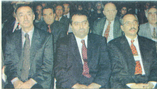
Sağlık Bakanı Osman Durmuş ile birlikte sempozyumun açılışına katılan İzmir Valisi Kemal Nehrozoğlu, İzmir'deki 2 büyük üniversite ile Sağlık Bakanlığı ve SSK hastanelerinin, sağlık sektörüne önemli hizmet verdiğini kaydetti.