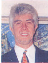
Ecz. Şapçı'nın Güngör Mengi'ye faxını siz değerlendirin

Yaşarken tüm entel ve aydın(?) çevrelerin demediği kalmadığı, RTÜK'ün yayın saatlerine bile müdahale ettiği "Kör ölür, badem gözlü olur" örneği Kemal Sunal aniden ve anlamsız (sanki diğer ölümler anlamlıymış gibi) bir biçimde ölünce bir yandan yere göğe konulmazken, bir yandan da Türkiye'de "İlk yardım" ın zaafiyeti yeniden gündem edildi.