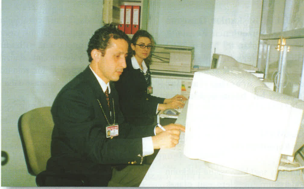
Karşıyaka Bürosu Çalışanları