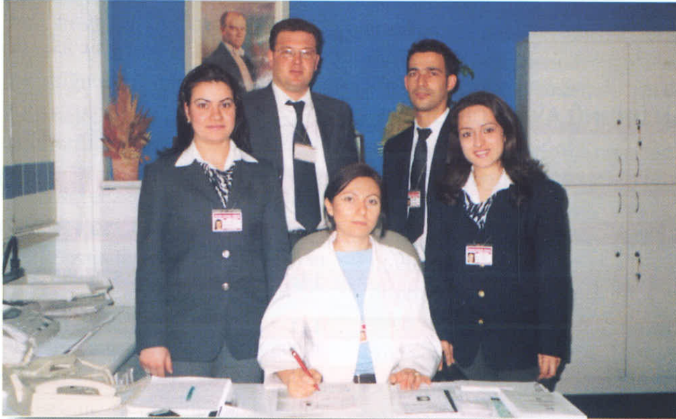
Bornova E.Ü. Büro Çalışanları