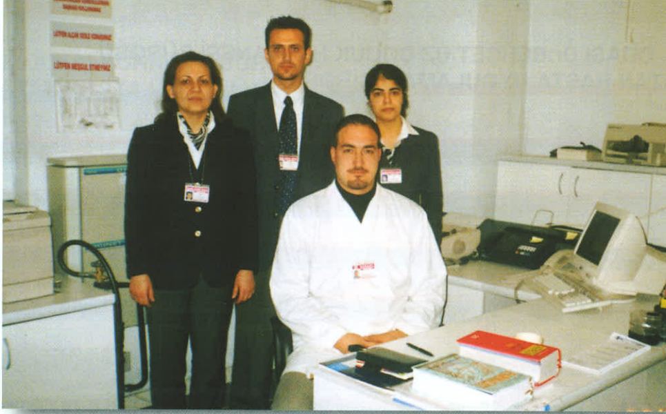
İnciraltı Bürosu Çalışanları