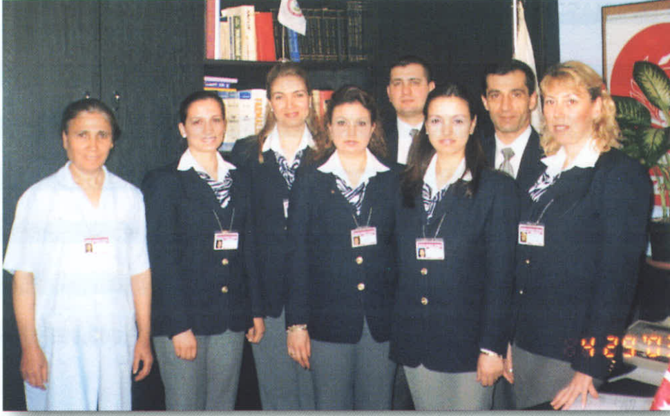
Merkez Büro Çalışanları