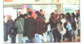
Dördüncü Ege Eczacılar Günü, Ege Üniversitesi Atatürk Kültür Merkezi'nde başladı.

Savunma harcaması kadar ilaç maliyeti. Sağlık Bakanlığı'na ruhsatlandırılması ve sadece eczanelerde eczacı gözetiminde sunulmasının doğru olduğuna inanıyoruz" dedi.