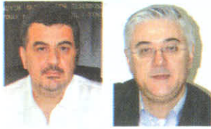
Tuncay Sayılkan Suat Kaptaner Sayılkan: Eczacı ile hastayı, karşı karşıya getirmeyin

İzmir Eczacılar Odası Başkanı Tuncay Sayılkan, bazı ilaçların sadece yasal yollarla değil, karaborsadan da ulaşılabildiğini söyledi. 'Bürokrasi bekletiyor' başlıklı yazısında, bazı ilaçların sadece yasal yollarla değil, karaborsadan da ulaşılabildiğini söyledi. 'Bürokrasi bekletiyor' başlıklı yazısında, bazı ilaçların sadece yasal yollarla değil, karaborsadan da ulaşılabildiğini söyledi.