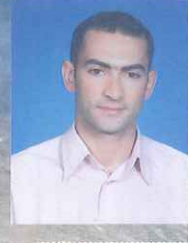
Hazırlayan Ecz. Köksal OFLUOĞLU

A slında anlatmak o kadar zor ki.... Kullanılacak kelimeleri seçerken, hem sizlere doğru şekilde anlatabilme kaygısı yaşıyorum hem de mekanları yeterince anlatamama endişesi kaplıyor beni.