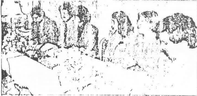
Her yıl geleneksel olarak kullanılan 14 Mayıs Eczacılık günü dün düzenlenen bir toplantı ile kullandı.

✓ Asıl tarihi 14 Mayıs Kurban bayramına rastlaması sebebi ile Kurban bayramı olan dünya eczacılık günü dün Eczacılar Odası Tesislerinde düzenlenen bir toplantı ile yapıldı.