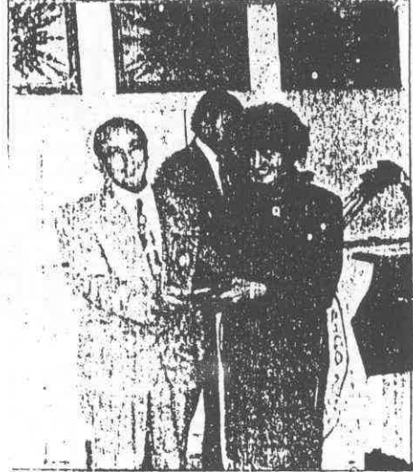
Düzenlenen toplantıda meslekte 25. yılını dolduran eczacılara plaket verildi.

toplantıda eczacılığın sorunları hakkında da bir süre konuştu.