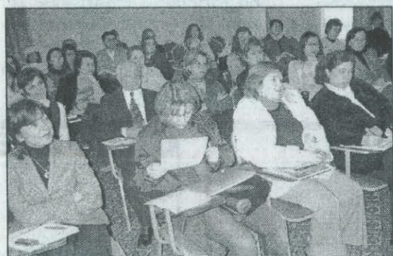
Grand Yükseliş Oteli'ndeki seminere ilimiz eczacıları büyük ilgi gösterdi.