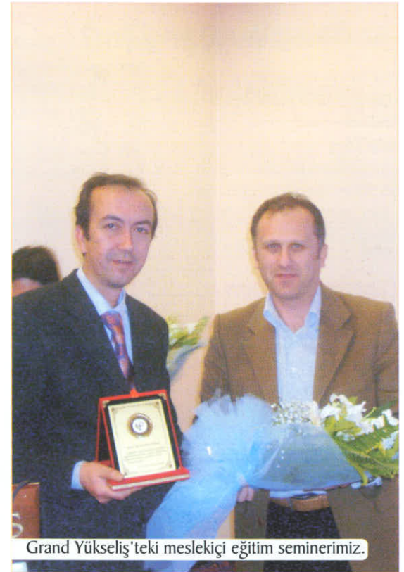
Grand Yükseliş'teki mesleki eğitim seminerimiz.