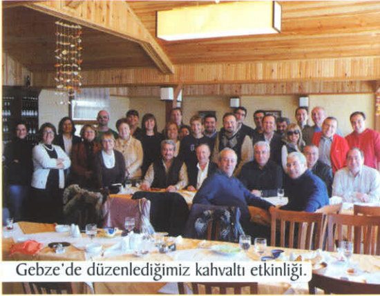
Gebze'de düzenlediğimiz kahvaltı etkinliği.