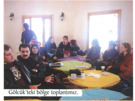
Gölcük'teki bölge toplantımız.