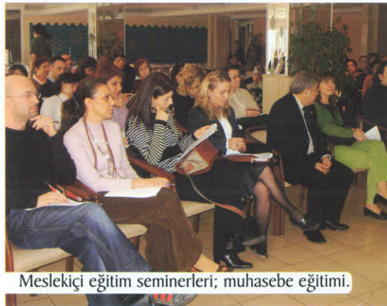
Mesleki eğitim seminerleri; muhasebe eğitimi.