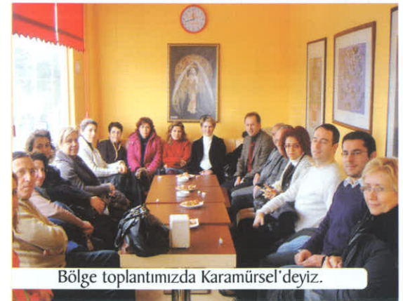
Bölge toplantımızda Karamürsel'deyiz.