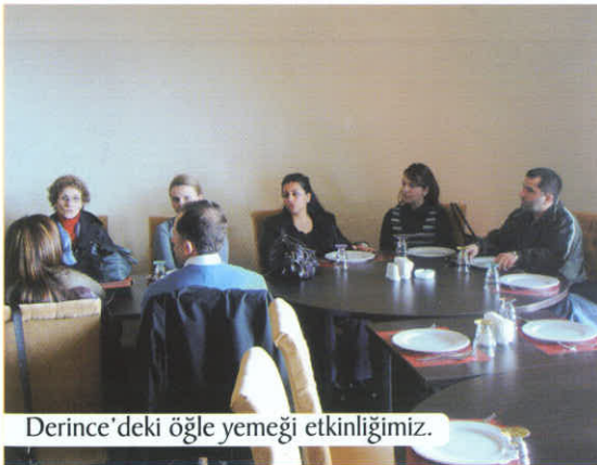
Derince'deki öğle yemeği etkinliğimiz.