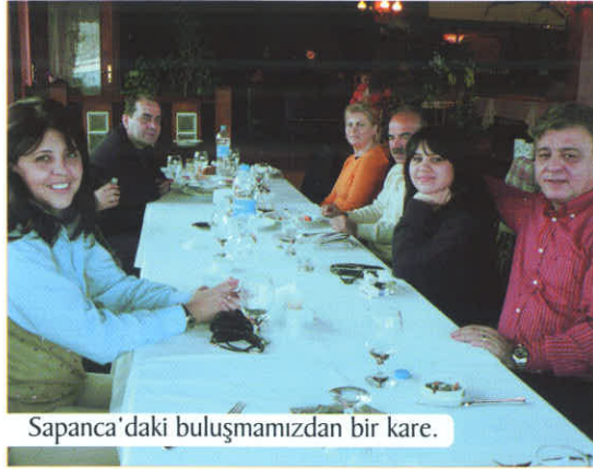
Sapanca'daki buluşmamızdan bir kare.