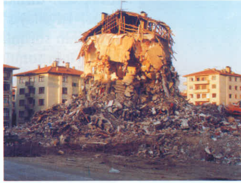
Ecz.Kemal Tanrıkul'un enkaz halindeki evi

Geldim dostum ufak bir ümitle ama koşarak. Yetişemedim ..