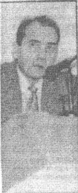
Kocaeli Eczacılar Odası Başkanı Ecz. Nejat Çetin