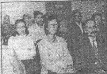
Genç Kocaelililer Derneği Lokali'nde yapılan mali genel kurulda, eczacılar çeşitli sorunları ele alıp, genel konuları da görüşme imkanı buldular.

31.Bölge Kocaeli Eczacılar Odası'nın yapılan mali genel kurulunda, eczacıların genel sorunları, ilaçta patent, ilaç reklamı ve eczane dışında ilaç satışları gibi konularda oda görüşleri ortaya konuldu.