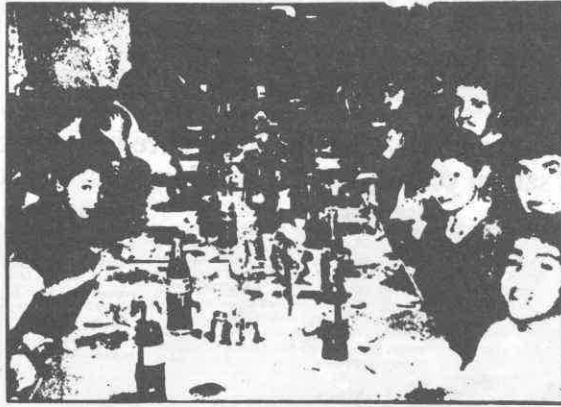
Çocuklar memnun- Yetiştirme Yurdu öğrencileri, Eczacılar Odası'nın jestinden memnun olduklar..