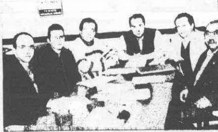
RAHATSIZLIK DUYUYORUZ -Kocaeli Eczacı Odası Yönetim Kurulu, 36 cente yani 80 bin Türk Lirasına alımı yapılan Hepatit-B aŐısının ithalatçı firmalar tarafından 4 milyon liraya varan fiyatlarla satılmasından Kocaeli'deki eczacıların büyük rahatsızlık duyduėunu ifade etti.