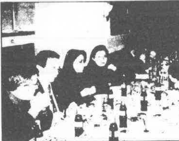
Afiyete- Yetiştirme Yurdu idari personeline katılım da olduğu iftarda tatlısından tuzlusuna menü oldukça zengindi.