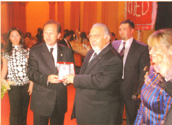
14 Mayıs Eczacılık Günü Balosu