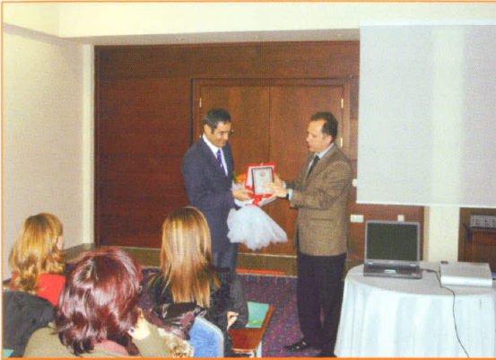
Kanser ve Özellikleri Konulu Seminer