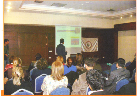
Kanser ve Özellikleri Konulu Seminer