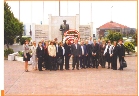
14 Mayıs Eczacılık Günü Sabahı Çelenk Koyma