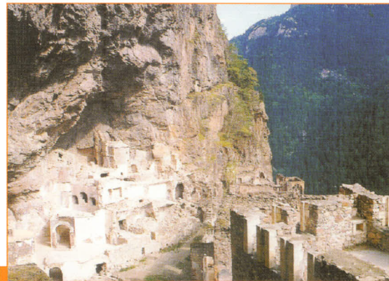
Kocaeli Eczacı Odası ve Bursa Ecza Koop. Ortaklığı ile Doğu Karadeniz-Batum Gezisi