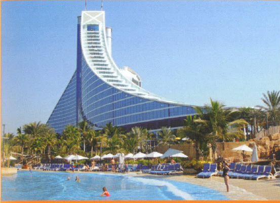
Kocaeli Eczacı Odası ve Bursa Ecza Koop. Ortaklığı İle Dubai Gezisi