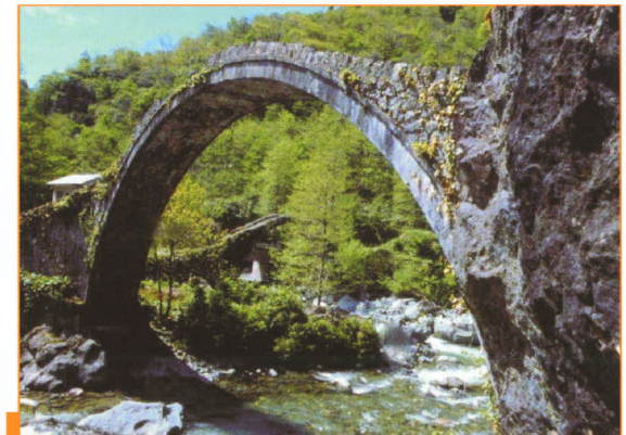
Kocaeli Eczacı Odası ve Bursa Ecza Koop. Ortaklığı İle Doğu Karadeniz-Batum Gezisi