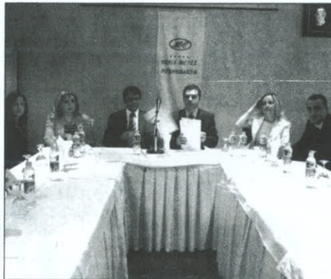
Diyarbakır Eczacılar Odası Yönetim Kurulu üyeleri, çok sayıda eczacı ve basın mensubu

11. Bölge Diyarbakır Eczacılar Odası, 14 Mayıs Eczacılar Günü nedeniyle Class Hotel Sadabat Salonu'nda kahvaltılı bir basın toplantısı düzenlendi. Toplantıya 11. Bölge