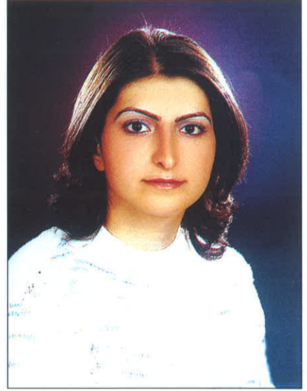
Yayına Hazırlayan Ecz. Elif ÇADIRCI

Başlı başına sağlık hizmeti veren son derece onurlu bir mesleğimiz var. Öyle ki bu dünyaya yeniden gelsem yine eczacılık yapmak isterdim. Yeni meslektaşlarımız lütfen mesleğin onuruna hizmet etsinler.