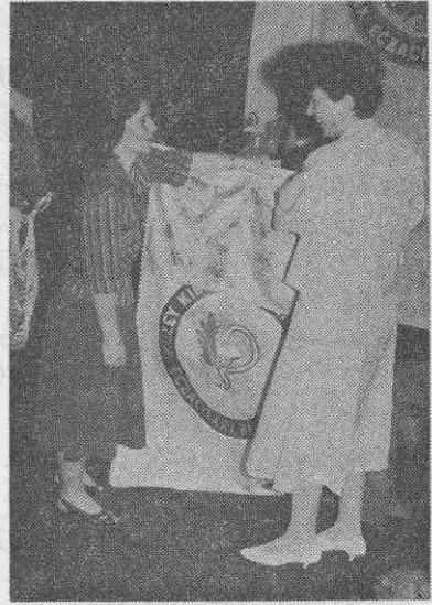
6. Bölge Eczacı Odasının Kıbrıs Türk Eczacılar Birliğine armağanı olan FLAMA verilirken