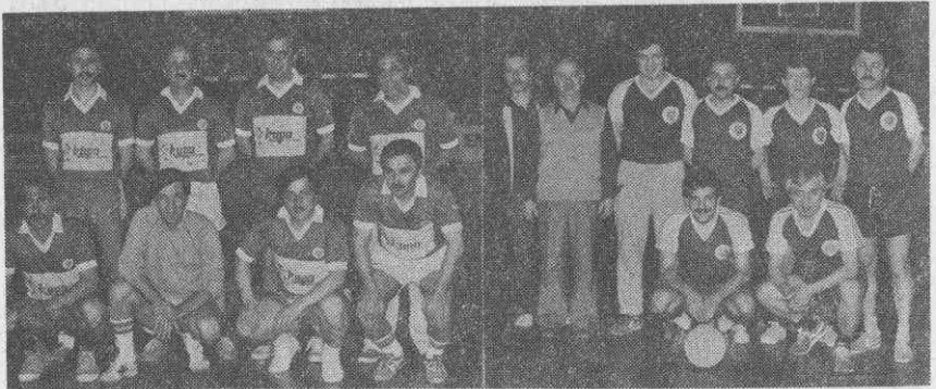
Turnuvanın 2. cisi Tıp Fakültesi Takımı