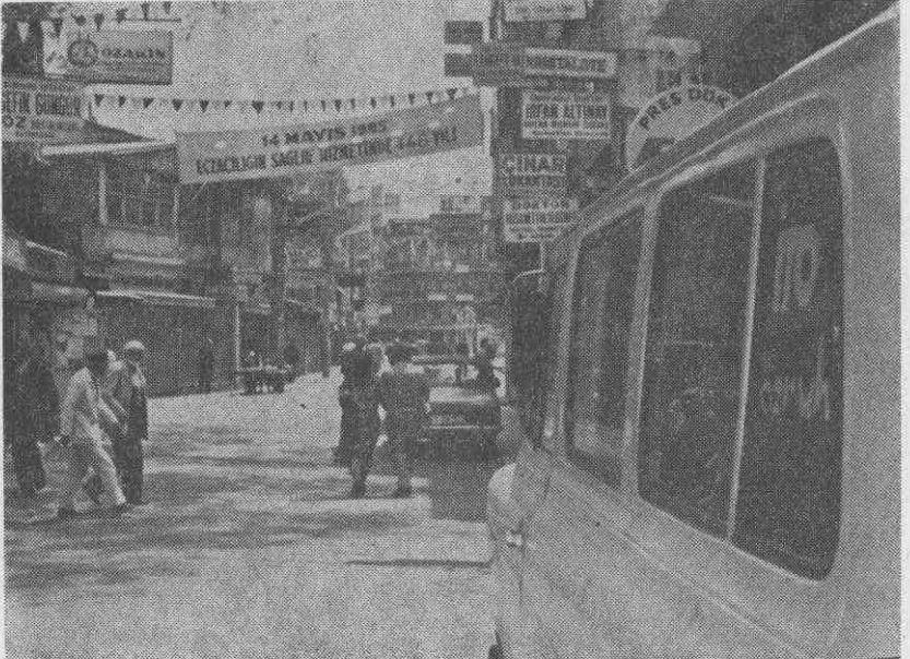
14. Mayıs'ta Caddelere asılan pankart