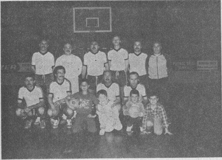
1985 Eczacılık Bayramı Futbol Turnuvası Şampiyonu Eczacı Takımı