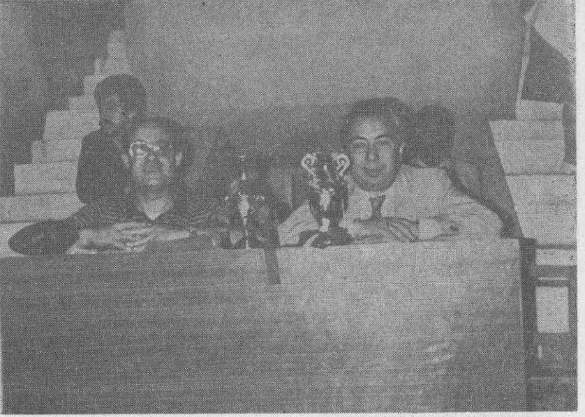
Salon Futbol Turnuasında TEB. ve 6. Bölge Eczacı Odasının koyduğu kupalar