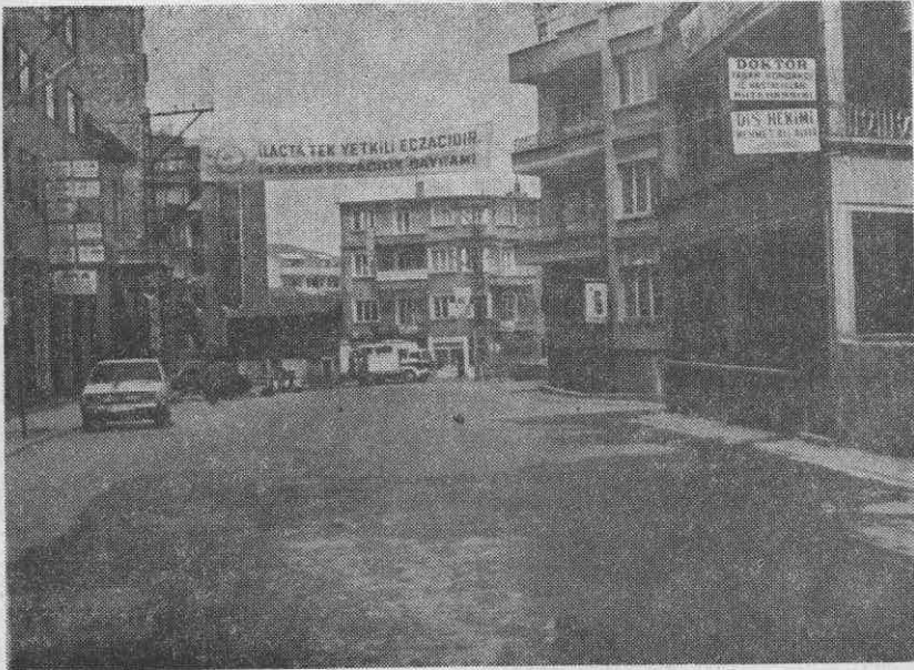
14. Mayıs'ta caddelere asılan pankartlar