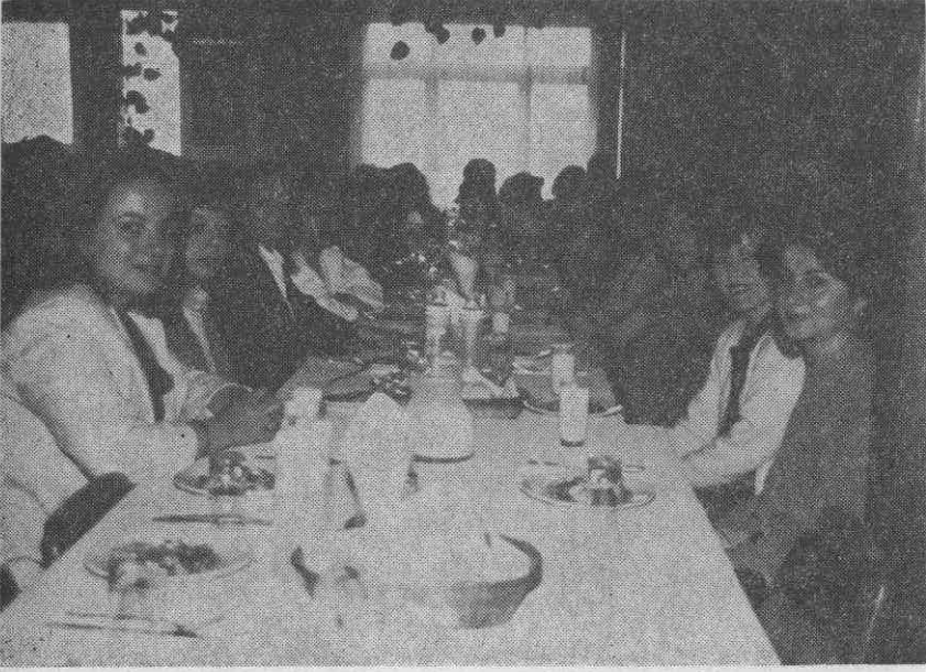
ADEKA İlaç fabrikasının ananevi öğle yemeğinden görüntüler.