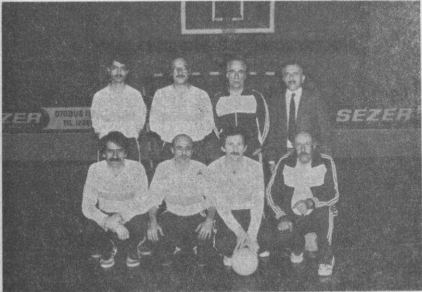
Turnuvanın Centilmen Takımı Serbest Hekimler