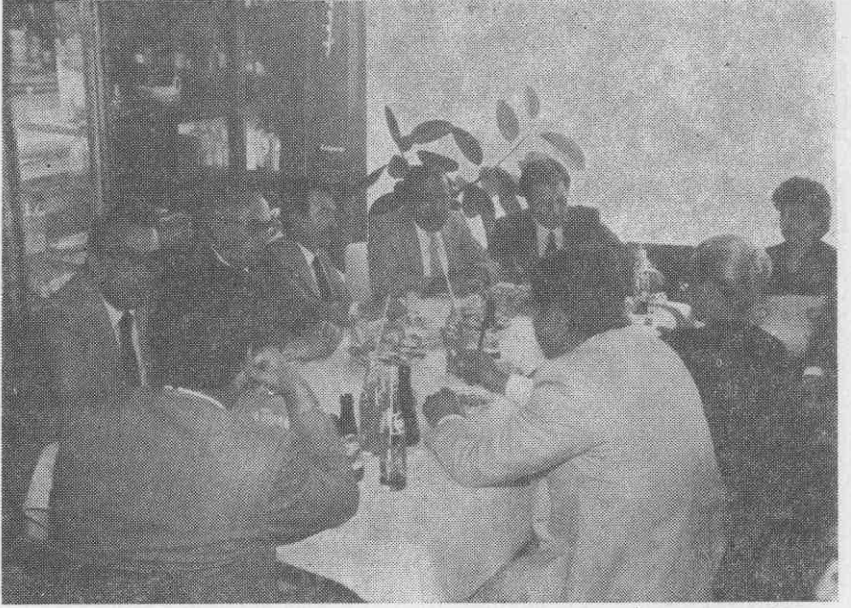
14 Mayıs Eczacılık Bayramı kokteylinde odamızdan görüntüler.