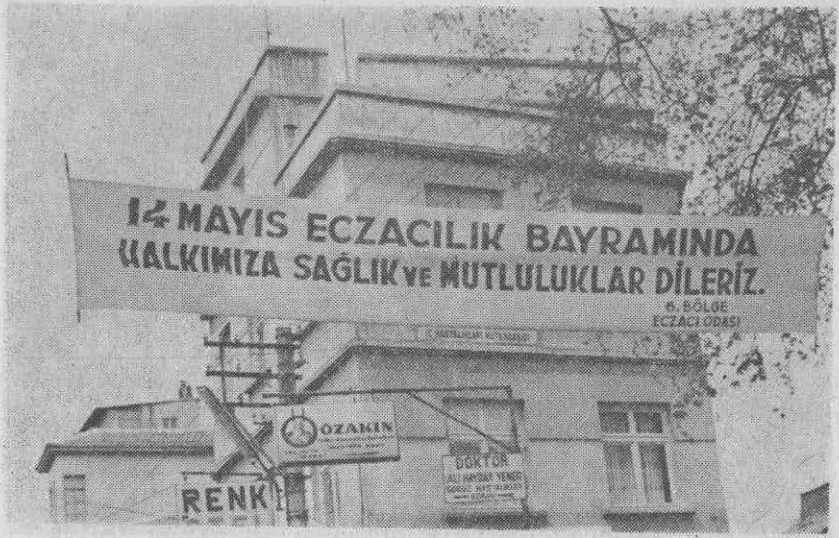
— Şehir içine asılan Pankartlardan bir görünüş. —