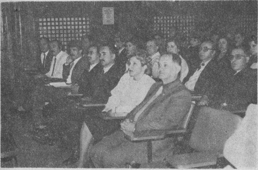
— Açık Oturum izleniyor.—