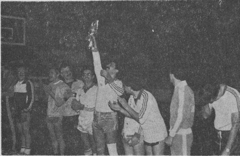
— Şampiyonluk sevinci —

lik içinde olduğumuz tüm kardeş Kamu Kuruluşu yetkililerine Odamız adına teşekkürü bir borç biliyoruz.