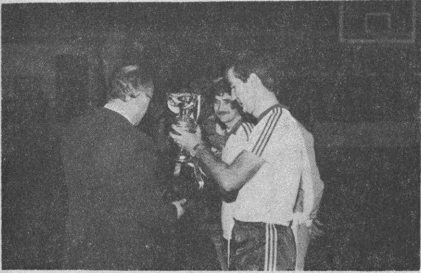
— Şampiyon ekip kupasını Sayın Valimiz Erdoğan Cebeci'nin elinden alıyor. —