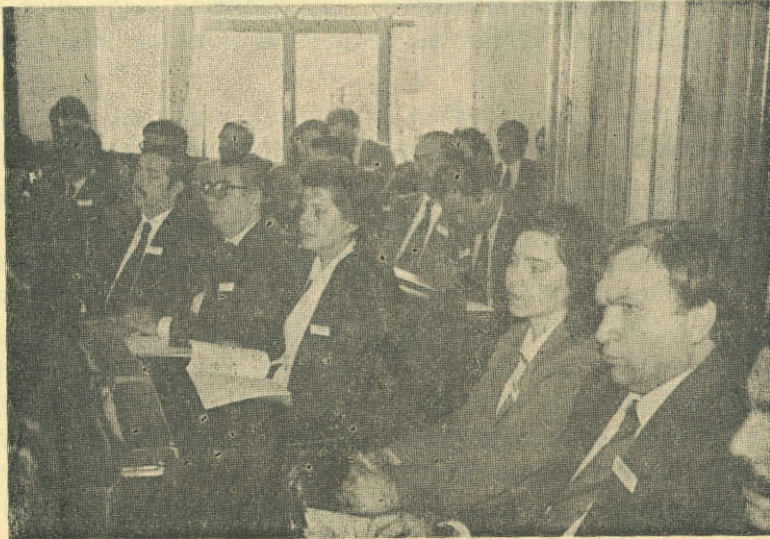
— Yönetim Kurulu Üyeleri Toplu Halde, Toplantıyı İzlerken —