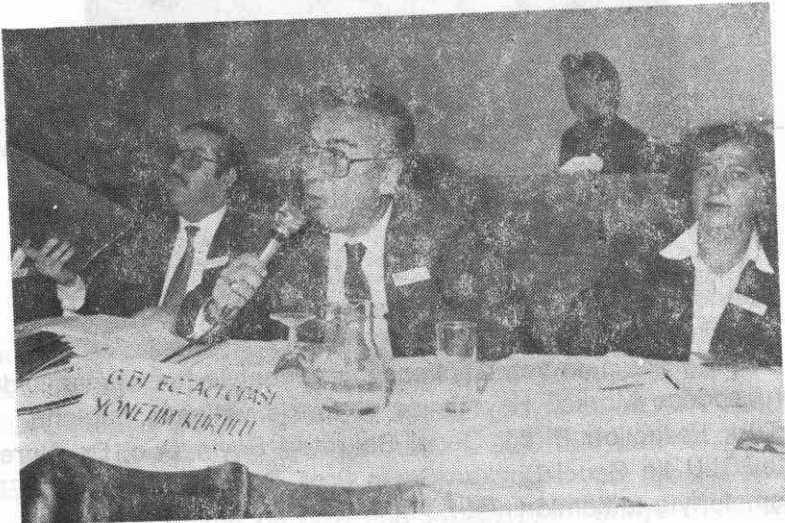
— Odamız Yönetim Kurulu —