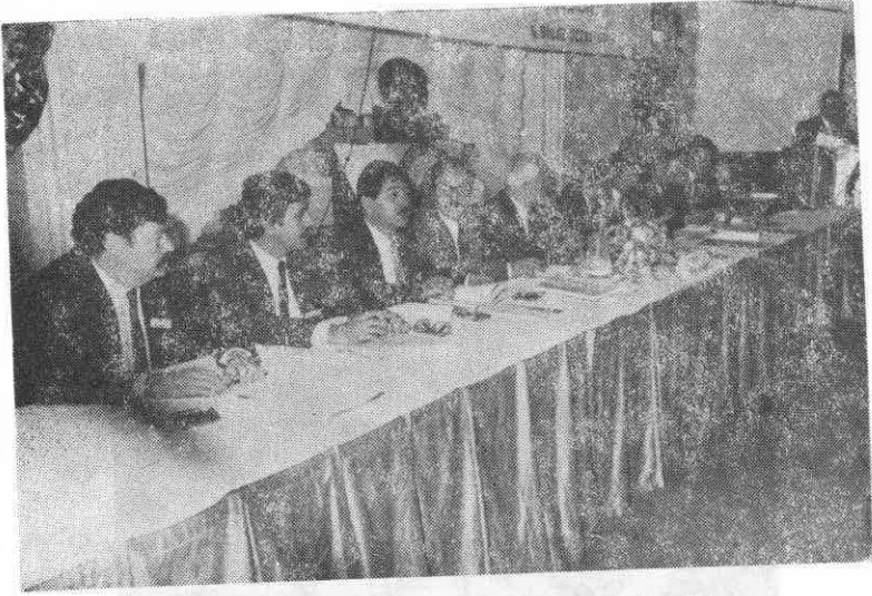
— Türk Eczacıları Birliği Merkez Heyeti —