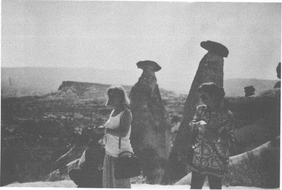
Periler ve Bacaları