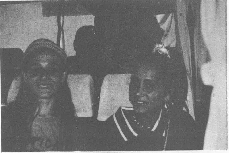
Hakikaten "GÜLE GÜLE" gittik.