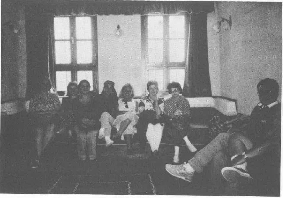
Halı pazarlığında verilen mola