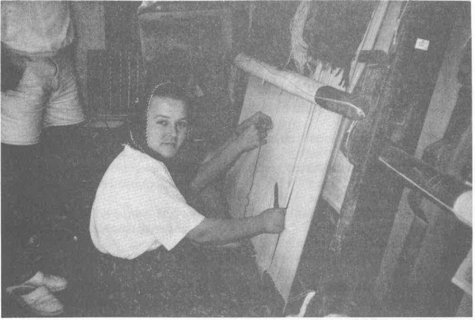
Halı dokuma tezgahları