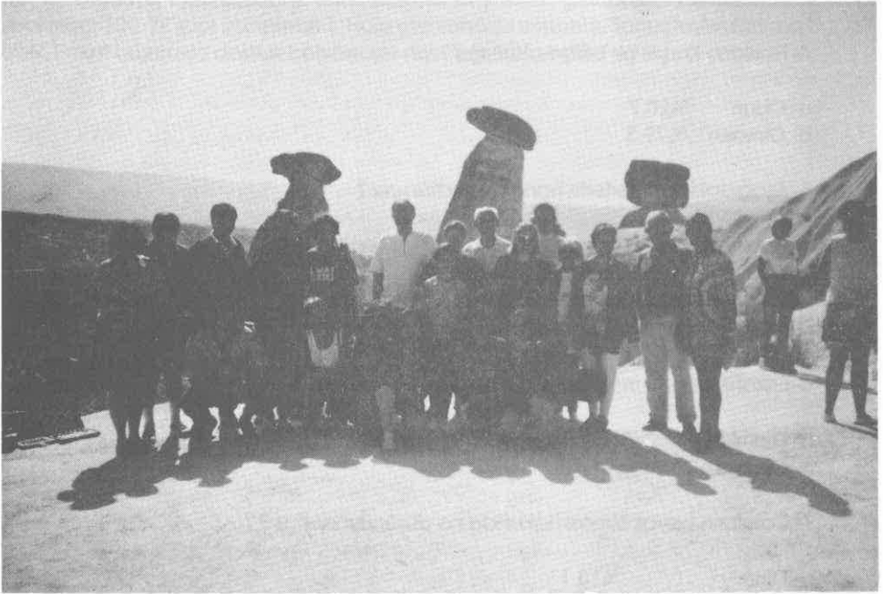
Ürgüp - Göreme fatihleri