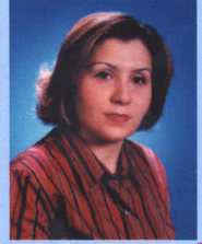
Hazırlayan Ecz. Sevil YILDIRIM

T rabzon'a açılan bir depo- nun müdürü olarak önce- likle kişi olarak kendinizi tanıtır mısınız?